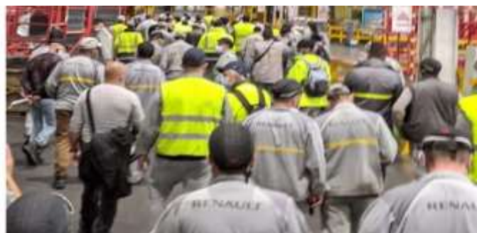
Rassemblement du 6 mai 2021 à l'usine de Douvrin