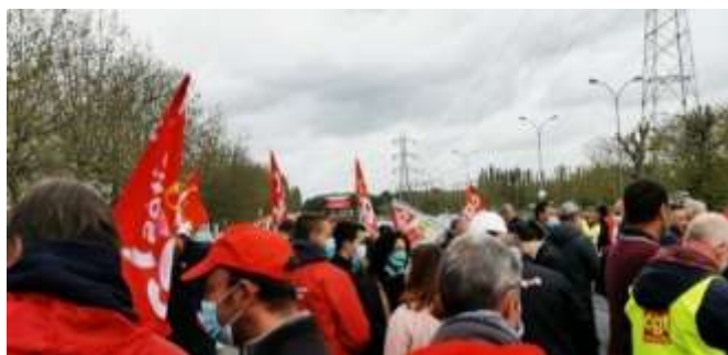
Salariés en Grève à Renault Flins ces jours-ci